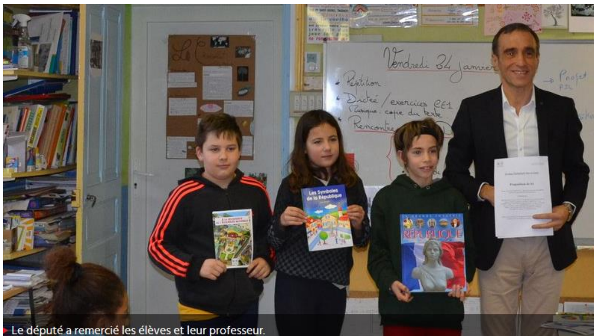
Le député a remercié les élèves et leur professeur.